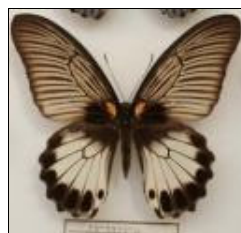
アゲハチョウ科 ナガサキアゲハ