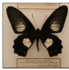
アゲハチョウ科 オナシベニモンアゲハ (ニューギニア)