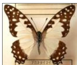
アゲハチョウ科 アカネタイマイ