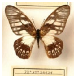
アゲハチョウ科 アガメデスタイマイ