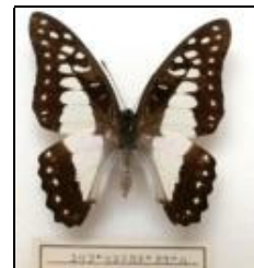
アゲハチョウ科 ユリプリスミカドアゲハ