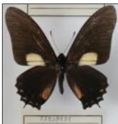
アゲハチョウ科 マエモンタイマイ