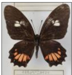
アゲハチョウ科 マエモンベニタイマイ