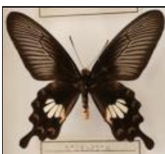
アゲハチョウ科 ベニモンアゲハ