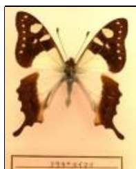
アゲハチョウ科 アサギタイマイ