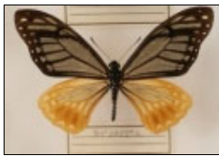
アゲハチョウ科 カバシタアゲハ