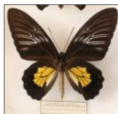
アゲハチョウ科 フィリピンキシタアゲハ