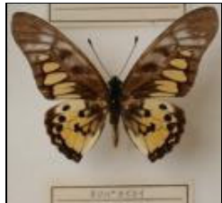
アゲハチョウ科 ホソバタイマイ