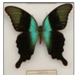
アゲハチョウ科 アオネアゲハ