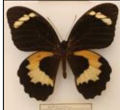
アゲハチョウ科 テデウスアゲハ