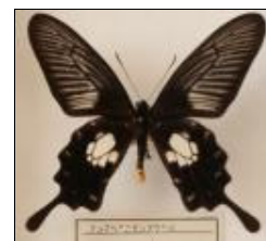
アゲハチョウ科 アンナベニモンアゲハ