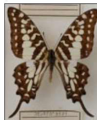
アゲハチョウ科 コモンオナガタイマイ