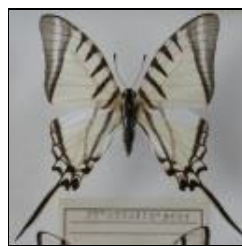
アゲハチョウ科 アゲシラウスオナガタイマイ