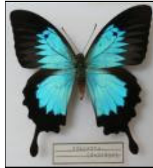
アゲハチョウ科 オオルリアゲハ (オーストラリア)