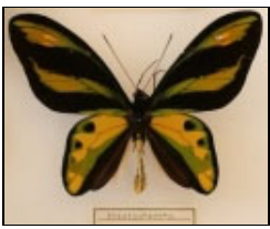
アゲハチョウ科 チトヌストリバネチョウ