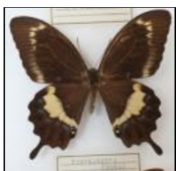
アゲハチョウ科 ネットアイモンキアゲハ (ソロモン)