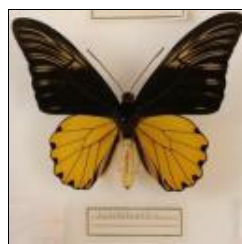
アゲハチョウ科 アンフリサスキシタアゲハ