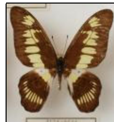
アゲハチョウ科 オビモンタイマイ