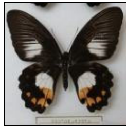
アゲハチョウ科 ツマジロモンキアゲハ