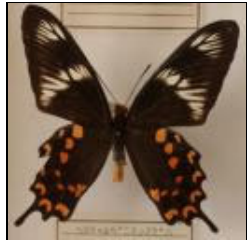
アゲハチョウ科 ヘクトールベニモンアゲハ