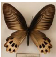
アゲハチョウ科 アケボノアゲハ