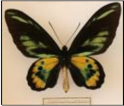
アゲハチョウ科 ロスチャイルドトリバネ アゲハ