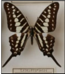
アゲハチョウ科 ヒメコモンオナガタイマイ