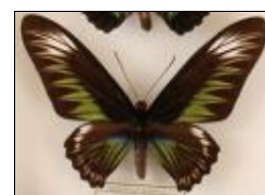
アゲハチョウ科 アカエリトリバネアゲハ