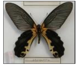
アゲハチョウ科 レテノールアゲハ