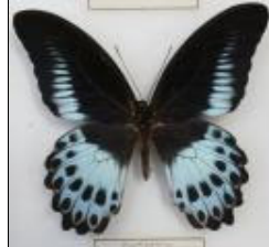
アゲハチョウ科 テンジクアゲハ