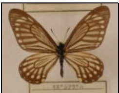
アゲハチョウ科 キボシアゲハ