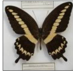
アゲハチョウ科 オオオビモンアゲハ