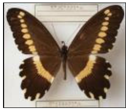
アゲハチョウ科 ガリエヌスアゲハ