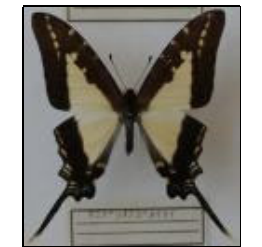
アゲハチョウ科 キミドリオナガタイマイ