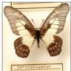
アゲハチョウ科 アダマストールタイマイ