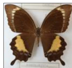
アゲハチョウ科 ネットアイモンキアゲハ (ニューギニア)