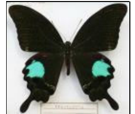
アゲハチョウ科 オオルリモンアゲハ