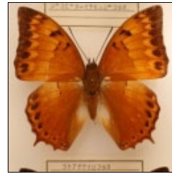
アゲハチョウ科 ヨトナチャイロフタオ