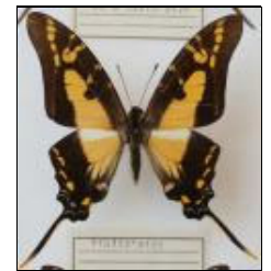
アゲハチョウ科 キイロオナガタイマイ