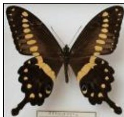
アゲハチョウ科 オオサカハチアゲハ