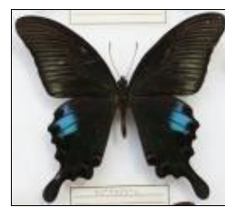
アゲハチョウ科 クジャクアゲハ