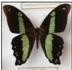
アゲハチョウ科 ニレウスルリアゲハ