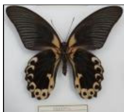
アゲハチョウ科 アカネアゲハ