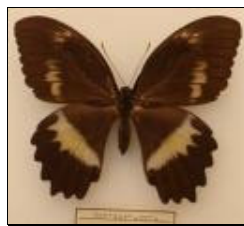
アゲハチョウ科 ウッドホルデーアゲハ