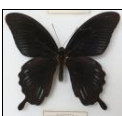
アゲハチョウ科 モロツカアゲハ