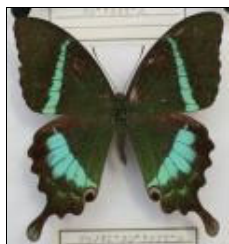
アゲハチョウ科 クリノオビクジャクアゲ ハ