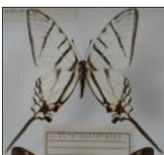
アゲハチョウ科 エピダウスオナガタイマイ