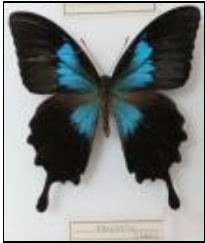
アゲハチョウ科 オオルリアゲハ (マヌス)