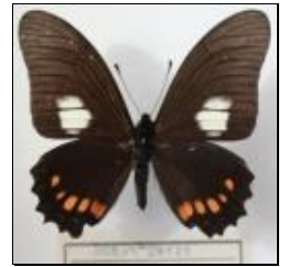
アゲハチョウ科 シロモンベニタイマイ