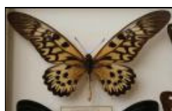
アゲハチョウ科 ドルリーオオアゲハ