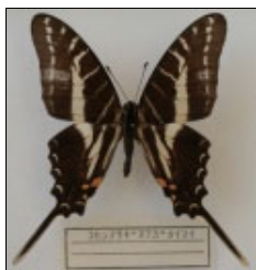
アゲハチョウ科 コモンアサギオナガタイ マイ