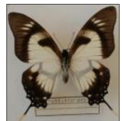
アゲハチョウ科 ドリカオンオナガタイマイ