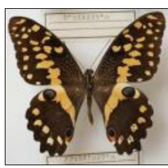
アゲハチョウ科 アフリカオナシアゲハ