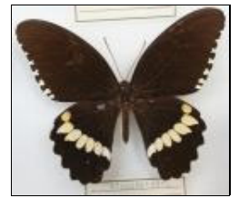
アゲハチョウ科 オナシシロオビアゲハ