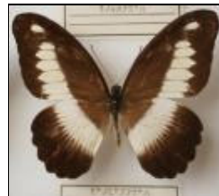
アゲハチョウ科 ゼノビアアゲハ