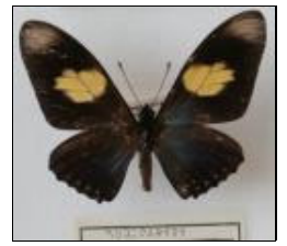
アゲハチョウ科 ヘリコニウスタイマイ