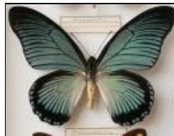
アゲハチョウ科 ザルモクシスオオアゲハ