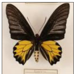
アゲハチョウ科 キシタアゲハ