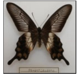
アゲハチョウ科 チモールベニモンアゲハ