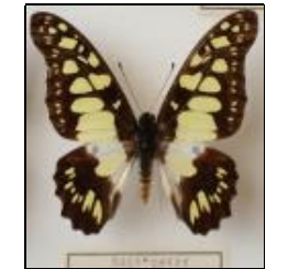
アゲハチョウ科 ウスミドリタイマイ