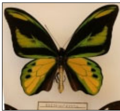
アゲハチョウ科 キマエラトリバネアゲハ