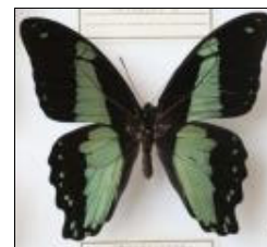
アゲハチョウ科 ブロミウスルリアゲハ