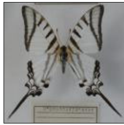
アゲハチョウ科 プロテシラウスオナガ イマイ