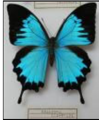
アゲハチョウ科 オオルリアゲハ (ニューギニア)