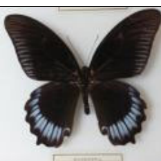
アゲハチョウ科 モロツカアゲハ (バチャン)