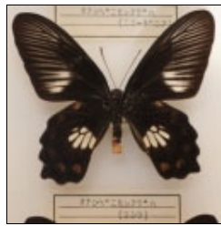
アゲハチョウ科 オナシベニモンアゲハ (ミシマ)