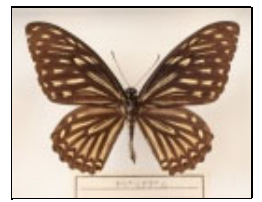
アゲハチョウ科 キベリアゲハ