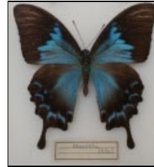
アゲハチョウ科 オオルリアゲハ (セラム)