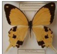
アゲハチョウ科 オスジロアゲハ