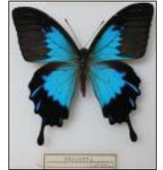
アゲハチョウ科 オオルリアゲハ (バチャン)