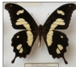
アゲハチョウ科 オオシロモンアゲハ