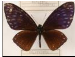
アゲハチョウ科 オオムラサキアゲハ