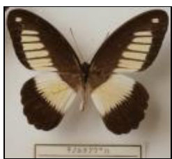
アゲハチョウ科 キノルタアゲハ