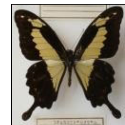
アゲハチョウ科 フォルカスミドリアゲハ