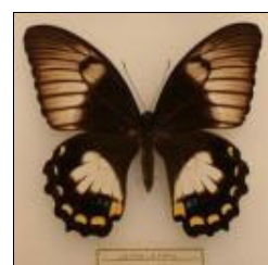
アゲハチョウ科 メスアカモンキアゲハ