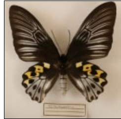
アゲハチョウ科 サビモンキシタアゲハ