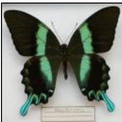
アゲハチョウ科 オオルリオビアゲハ