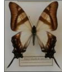
アゲハチョウ科 セルピーレオナガタイマ イ