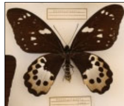
アゲハチョウ科 キマエラトリバネアゲハ (メス)