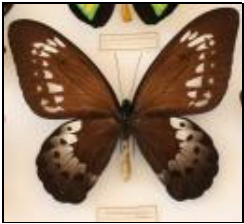
アゲハチョウ科 ゴラヤストリバネアゲハ (メス)