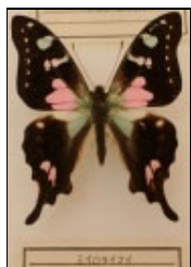
アゲハチョウ科 ミイロタイマイ