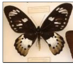
アゲハチョウ科 ゴクラクトリバネアゲハ (メス)