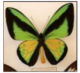
アゲハチョウ科 ゴラヤストリバネアゲハ