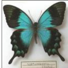
アゲハチョウ科 ヘリボシアオネアゲハ (イリアン)