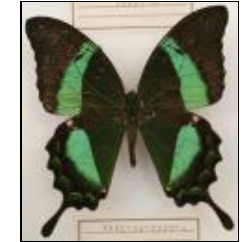
アゲハチョウ科 オオオビクジャクアゲハ