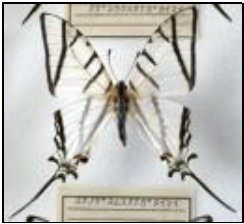
アゲハチョウ科 ステノデスムスオナガ イマイ