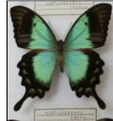
アゲハチョウ科 ヘリボシアオネアゲハ (オビ)