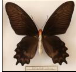
アゲハチョウ科 セジロアケボノアゲハ