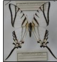
アゲハチョウ科 テレシラウスオナガ イマイ