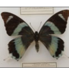
アゲハチョウ科 ニセツバメアゲハ