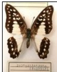
アゲハチョウ科 ユリプリスミカドアゲハ (オーストラリア)