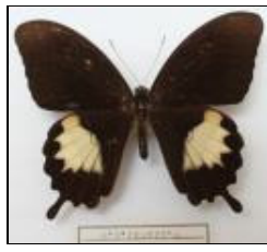
アゲハチョウ科 パプアモンキアゲハ