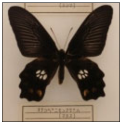
アゲハチョウ科 オナシベニモンアゲハ (マヌス)