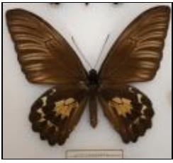
アゲハチョウ科 パプアキシタアゲハ