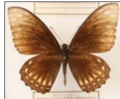
アゲハチョウ科 キベリアゲハ (黒化型)