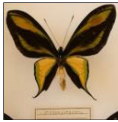
アゲハチョウ科 ゴクラクトリバネアゲハ