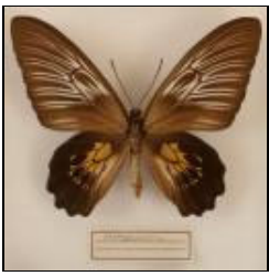
アゲハチョウ科 フチグロキシタアゲハ