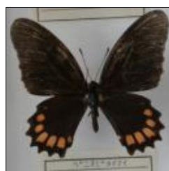
アゲハチョウ科 ベニオビタイマイ