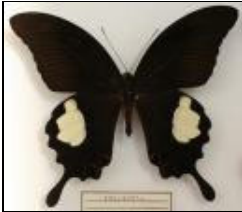
アゲハチョウ科 オオモンキアゲハ