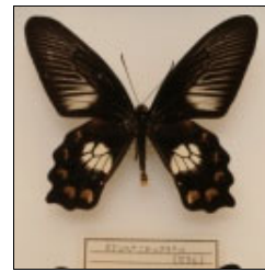
アゲハチョウ科 オナシベニモンアゲハ (セラム)