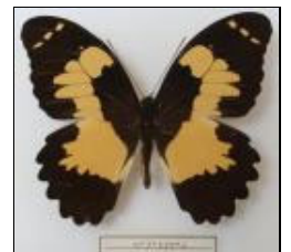
アゲハチョウ科 パプアアゲハ