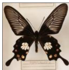
アゲハチョウ科 マリアベニモンアゲハ